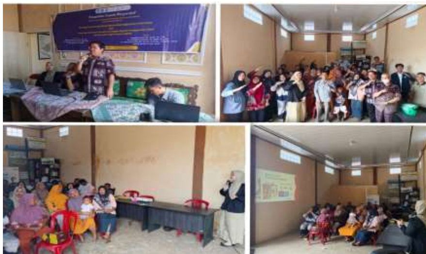
Gambar 2. Dokumentasi Kegiatan Pelatihan Interaktif Literasi Keuangan Digital

menyampaikan pendapatnya. Kegiatan pelatihan ini juga dilengkapi dengan praktik interaktif berupa pendampingan langsung ( hands-on learning ) dari tim pengabdian kepada peserta UMKM untuk melakukan praktik simulasi penggunaan QRIS dan E-wallet (DANA, OVO, dan ShopeePay). Pada sesi praktik ini peserta dibagi menjadi beberapa kelompok kecil, dan setiap kelompok didampingi oleh anggota tim pengabdian agar sesi praktik berjalan lebih efektif mengingat kemampuan digital peserta berbeda-beda. Kegiatan selanjutnya tim pengabdian melakukan evaluasi pelatihan interaktif, yaitu meminta para peserta pelatihan mengisi kuesioner untuk melihat respon mereka terhadap kegiatan ini dan mengetahui tingkat pemahaman peserta setelah mengikuti pelatihan interaktif literasi keuangan digital penggunaan QRIS dan E-wallet ini. Sebagai penutup rangkaian kegiatan diadakan semacam kuis berhadiah untuk mengapresiasi peserta pelaku UMKM yang bisa menjawab pertanyaan seputar materi pelatihan, terakhir melakukan sesi foto bersama para tim pengabdian, perangkat desa, dan para peserta pelaku UMKM Desa Tapak Gedung.