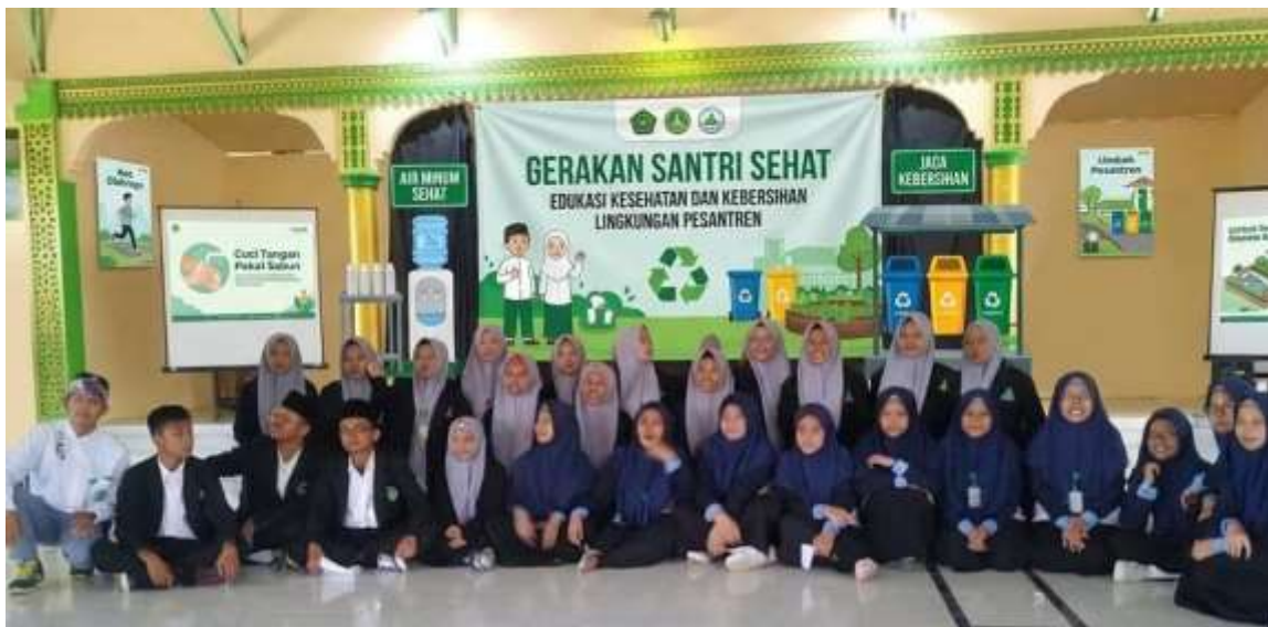
Gambar 1 . Tim Sosialisasi di Auditorium YPPSD Bersama Para Pengurus

Dari 120 santri yang menjadi peserta, 58,3% berjenis kelamin perempuan dan 41,7% laki-laki. Rentang usia 13–18 tahun dengan kelompok usia 15–16 tahun sebagai mayoritas (42,5%). Berdasarkan jenjang pendidikan, 55% dari Madrasah Aliyah (MA) dan 45% dari Madrasah Tsanawiyah (MTs). Seluruh peserta telah tinggal di pondok minimal 6 bulan sehingga telah terpapar kondisi lingkungan pesantren secara memadai.