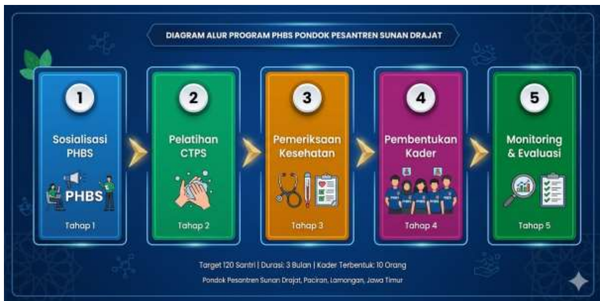
Gambar 1. Alur Program Pendampingan Gerakan Pesantren Bersih dan Sehat