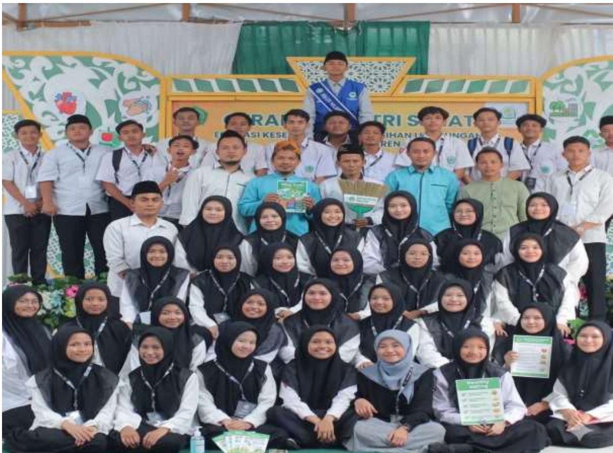
Gambar 3. Foto Bersama setelah pelaksanaan panitia dengan para siswa siswi

Faktor pendukung keberhasilan program meliputi: dukungan penuh pimpinan pesantren, antusiasme tinggi para santri, serta keselarasan nilai-nilai kebersihan dalam ajaran Islam ( al-nadzafatu minal iman ) yang memperkuat motivasi internal santri. Faktor penghambat yang diidentifikasi antara lain: heterogenitas tingkat pendidikan santri yang memerlukan penyesuaian materi, terbatasnya fasilitas sanitasi yang memengaruhi praktik ideal, serta jadwal kegiatan pesantren yang padat sehingga membutuhkan fleksibilitas dalam penjadwalan sesi pendampingan (Memah & SKM, n.d.2022.)